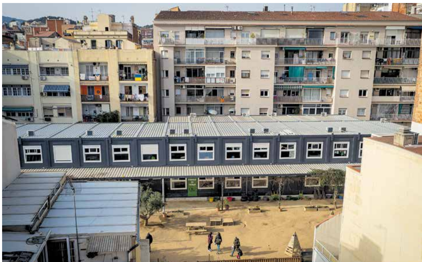
L'escola Teixidores de Gràcia, que imparteix classes en barracots mentre espera una nova ubicació. DANI CODINA

Barcelona té competències per participar en la construcció i el manteniment de centres educatius públics i en la vigilància de l'escolaritat obligatòria dels alumnes. També pot intervenir en la programació i la gestió de programes d'ensenyament, així com plans de formació ocupacional i d'inserció laboral. La reparació, neteja, manteniment i vigilància dels centres públics de primària i els centres propis de la ciutat són competència del Consistori, que també ha de gestionar cessions de sòl per construir-hi escoles i impulsar la creació d'escoles bressol municipals.