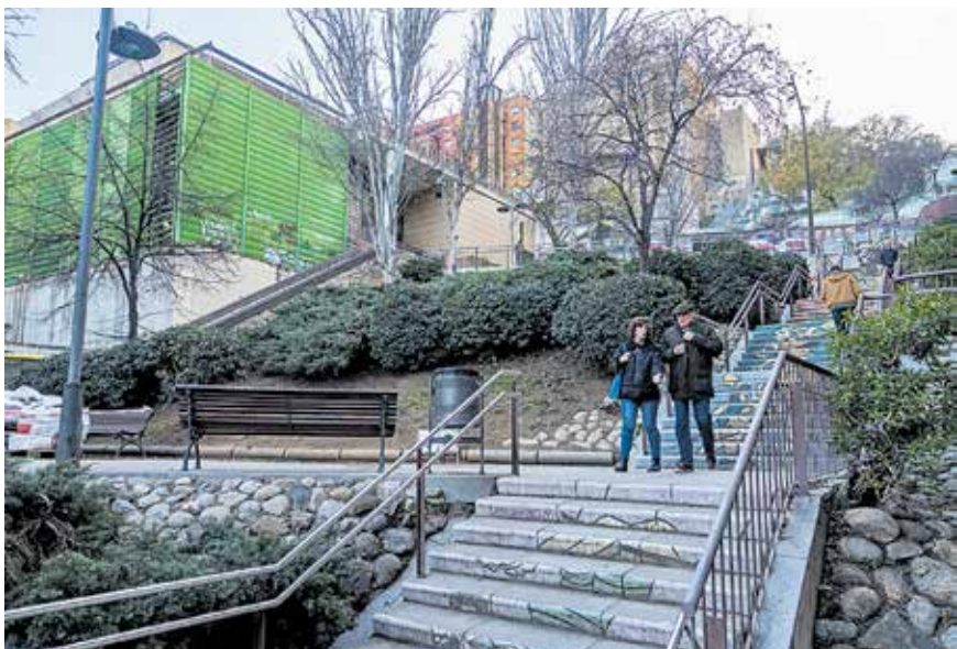
Escales del carrer de l'Alguer, al barri del Carmel. DANI CODINA

Les associacions també critiquen la poca freqüència i la lentitud del servei d'autobús