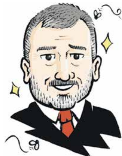
Jaume Collboni PSC

Aspira a un tercer intent de governar Barcelona sense les crosses indesitjables del passat recent en un escenari polític encara més incert. Vuit anys al capdavant del govern municipal, amb les seves llums i ombres, lli-men les arestes revolucionàries de qualsevol i converteixen el més somiatruïtes en un hàbil equilibrista del poder, per això Ada Colau ja no visita tant el barri de Ciutat Meridiana ni es posa la disfressa d'activista veïnal per Carnaval. Amb l'alcaldeable dels Comuns no hi ha terme mig: o enlluerna o treu de polleguera. Els seus acòlits li han permès optar a un tercer mandat vulnerant el Codi Ètic del partit perquè a les primàries internes ningú ha gosat plantar-li cara. I és que com a la Reina de Cors, a Colau no li agrada que li facin ombra. Entre els seus detractors hi ha de tot: des dels progres decebuts per la seva deriva cap al despatx i el cotxe oficial als que la menyspreen per dona, per comunista, per ambigua o per ambiciosa. Per sort, la tensió i el desgast del processisme ja han passat i ara, amb un Maragall desorientat i un Collboni fent d'oposició, Colau pot dedicar els seus esforços a explicar la feina feta -la no feta no cal- i a desaparar la seva artilleria dialèctica contra un Trias que prou feina té a posar ordre al seu corral.