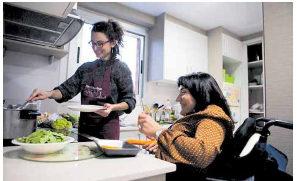
Una assistenta personal ajuda una dona amb discapacitat.

En definitiva, el gran repte de l'Ajuntament no és només promoure polítiques transversals que afavoreixin la inclusió de les persones amb discapacitat -tenint en compte tota la seva diversitat!- a tots els àmbits de la vida, sinó treballar per a una veritable erradicació del capacitisme: tot allò que ens oprimeix i ens discrimina, l'arrel de les desigualtats que vivim.