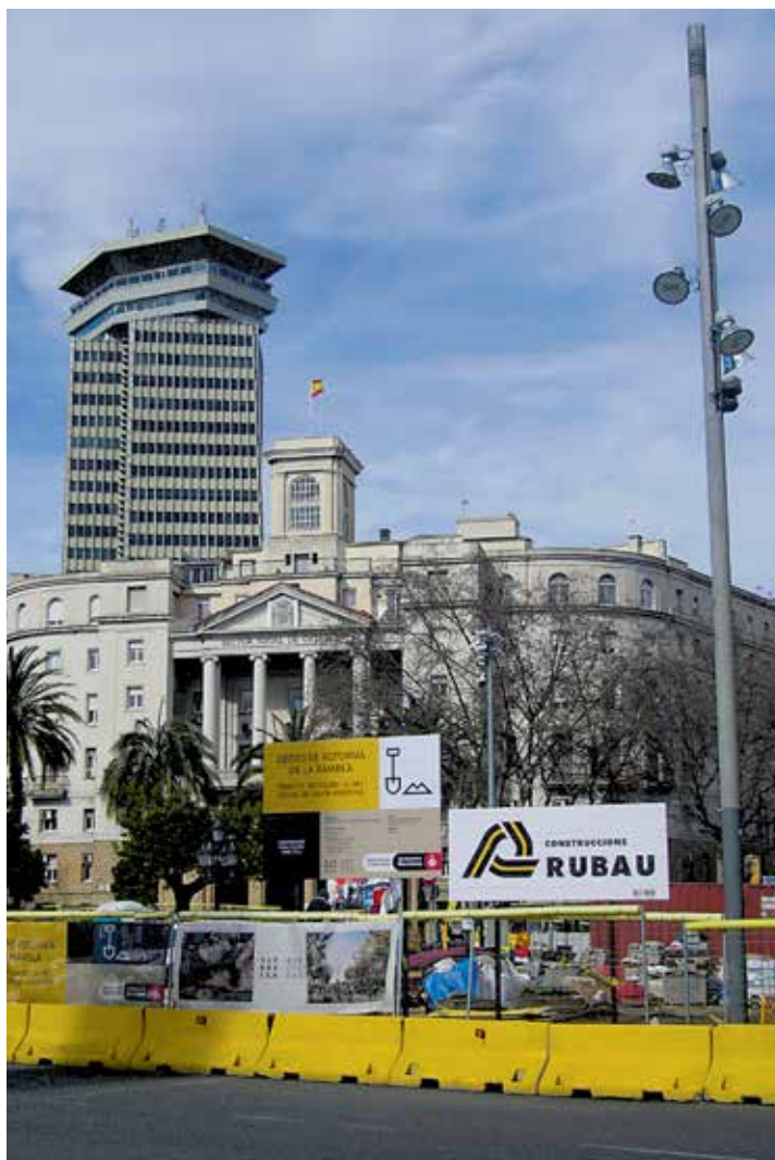
La reforma de la Rambla, iniciada l'octubre passat. CARRER

No obstant això, en termes pressupostaris, la gran operació urbanística del mandat és la plaça de les Glòries. Ja fa quasi una dècada de l'enderroc del tambor viari olímpic, però el punt d'inflexió ha estat l'estrena dels túnels de la Gran Via