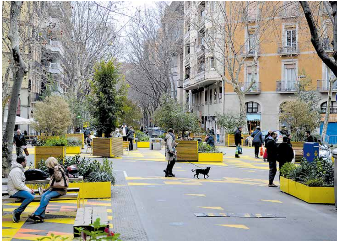
Urbanisme tàctic a la Superilla de Sant Antoni, que hauria de quedar enllestida el pròxim mandat.

La Meridiana ja són figures d'un altre paner. La nova configuració crea una rambla per a ciclistes al mig de la calçada