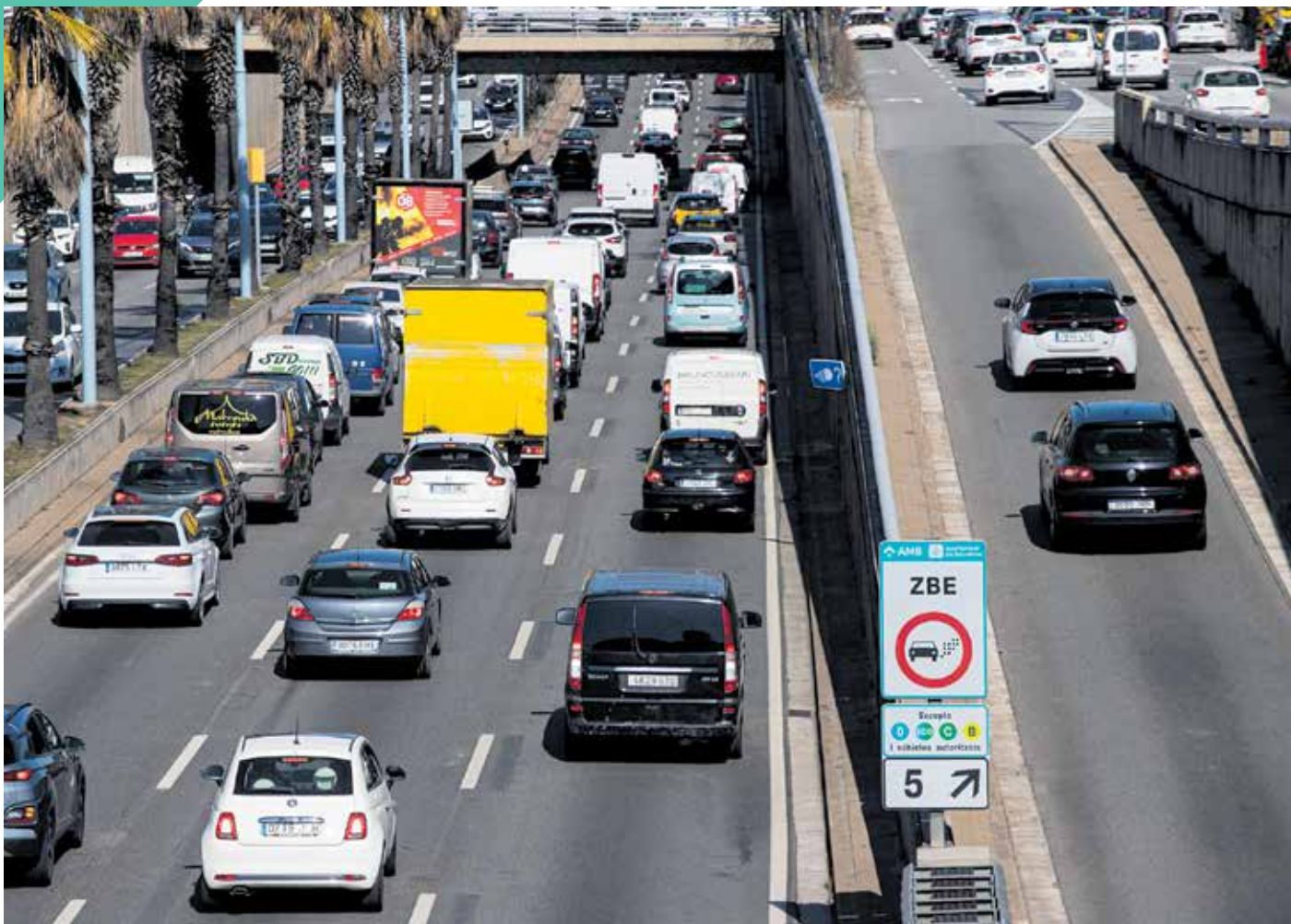
Trànsit a la ronda de Dalt. En primer pla, un cartell de la Zona de Baixes Emissions, a l'altura de Montbau.