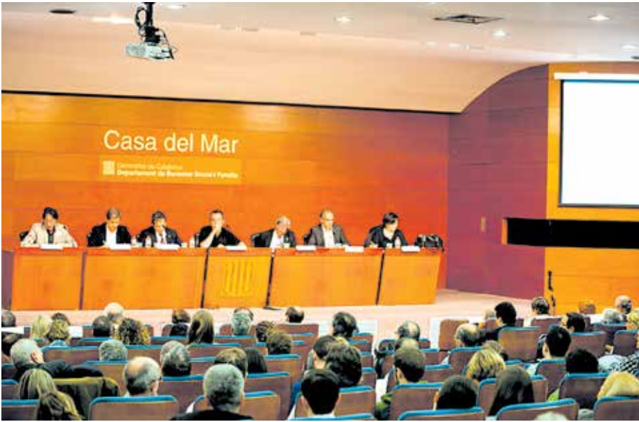
Debat amb els alcaldables i els representants veïnals, l'any 2011.