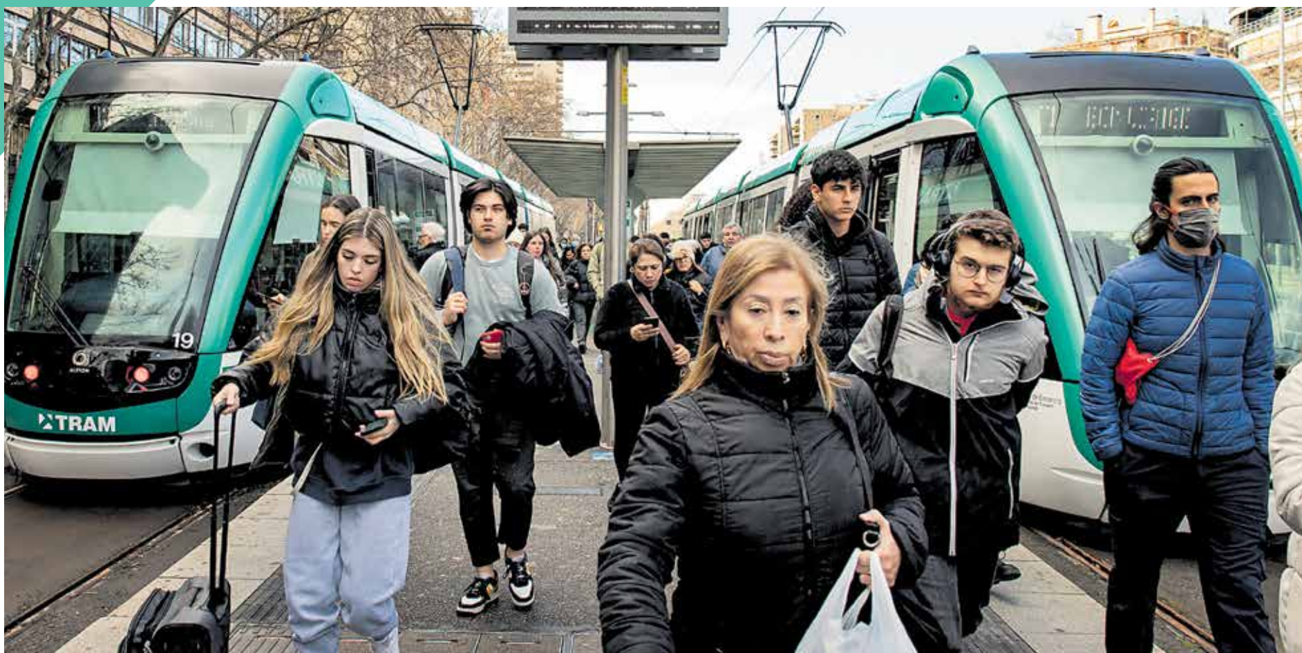
Final de trajecte del Trambaix en dia laborable a la Diagonal, abans d'arribar a la plaça de Francesc Macià. MARC JAVIERRE