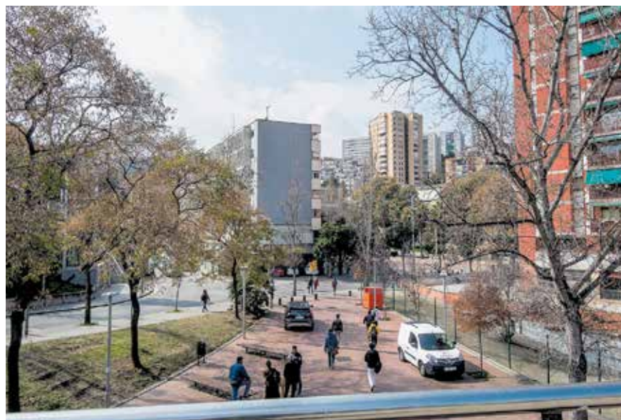
Vista dels blocs de Ciutat Meridiana.