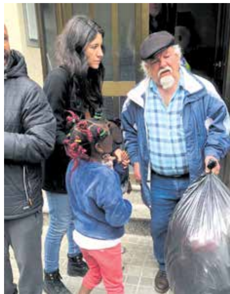
Veïns en el desnonament d'una família a Ciutat Meridiana, el passat 7 de març.

Barris i professionals s'organitzen per reclamar més inversió social, plans sense data de caducitat i una millor col·laboració entre les Administracions