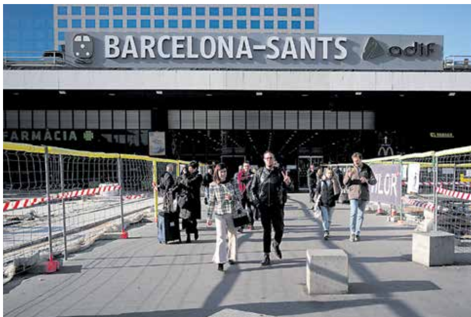
Obres a l'estació a l'espera de l'ambiciós projecte de remodelació. JOAN MOREJÓN

La reforma i ampliació de la infraestructura ferroviària, parcialment finançada per fons europeus, hauria d'iniciar-se aquest any i concloure's el 2026