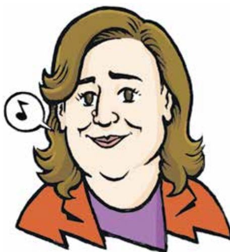
Ada Colau BARCELONA EN COMÚ

Poc marge de maniobra li està deixant el seu partit a Ernest Maragall per fer una campanya lluïda a Barcelona. El pacte amb el PSC per tirar endavant els pressupostos catalans a pocs mesos dels comicis municipals, el suport que des de fora han donat els republicans als projectes del bipartit barceloní i la irrupció per sorpresa de Trias compliquen molt les coses a l'alcaldeable d'ERC. Tanmateix, Maragall és un animal polític i no és dels qui s'arronsa a la primera derrota, tot i que n'acumula unes quantes. Malgrat haver exercit de diputat més que de regidor durant aquest mandat, ell segueix convençut que és el candidat "del futur" a Barcelona perquè fa números i li surt que "el llegat de Trias és Colau i el llegat de Colau és una ciutat dividida i enfadada". L'estratègia ara és ignorar Collboni per estalviar energies i rebaixar la intensitat processista presentant-se com un candidat centrat, amic dels pactes i amb experiència a l'hora de treure les castanyes del foc. Afirmar que se sent amb més ganes de fer coses que fa quatre anys, i aquest missatge no és només per als qui esmenten la seva edat, és sobretot un avís al seu partit perquè no el substitueixi en l'últim moment, com és tradició, i no utilitzi Barcelona com a moneda de canvi d'altres negocis més lucratis.