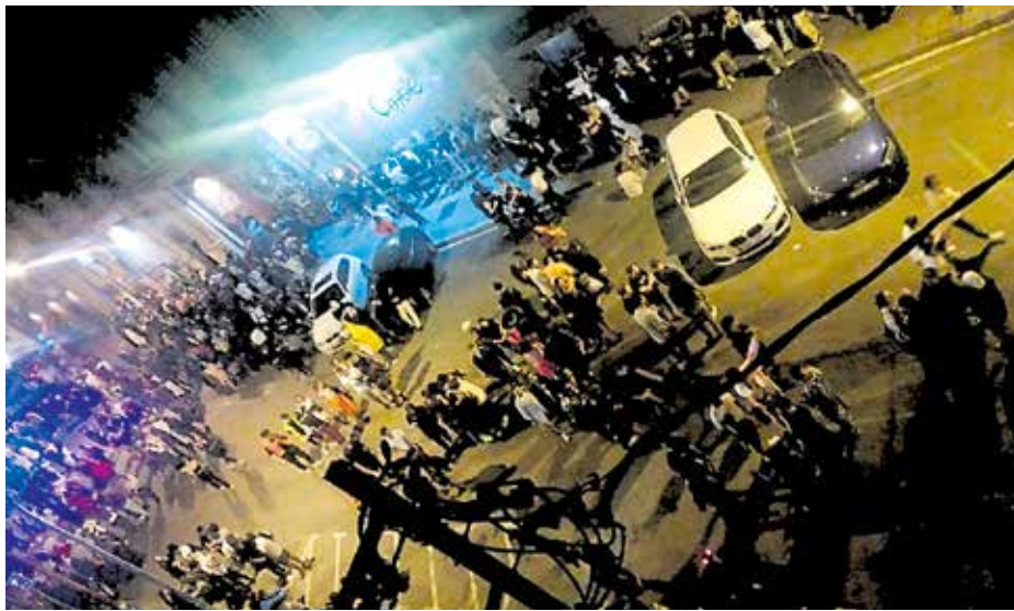
Una nit qualsevol al carrer de Pere IV. SOS TRIANGLE GOLFO

sociació Veïnal de Sant Andreu de Palomar. "Si la Meridiana es converteix en una rambla més amable i que no parteixi el territori, com ho fa ara, la gent ho tindrà més fàcil per anar d'una banda a l'altra", assumeix Ruiz. Una actuació que, en tot cas, demanen que vagi acompanyada d'alternatives per a les persones que entren i surten en cotxe de la ciutat per l'avinguda: "No només ens podem centrar a reduir carrils; també hem de canviar el paradigma de mobilitat i fer un projecte de transport públic més potent, amb més aparcaments dissuasius, més freqüències de tren i més estacions d'autobusos", apunten des de l'AV de Prosperitat. DAVID G. MATEU