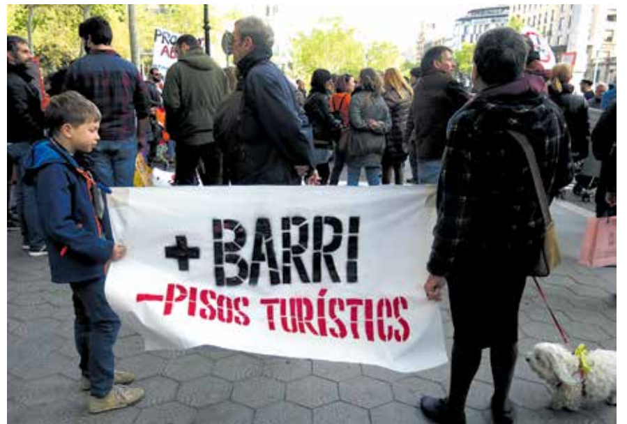
Manifestació veïnal per denunciar el model turístic.

En termes convencionals, l'economia de Barcelona presenta uns resultats acceptables. S'ha reconvertit des d'una economia fonamentalment industrial cap a una de serveis, ha superat successives crisis i la ciutat segueix essent una metròpoli de segon ordre en l'economia global. Malgrat que el turisme ha jugat un paper important en la reconversió i és la cara més visible del model, l'activitat està més diversificada: sobretot en les TIC [Tecnologies de la Informació i la Comunicació], la sanitat, l'educació i la recerca, el comerç i en tota la gamma de serveis que genera una àrea com la nostra. Quan, en canvi, l'avaluació es fa des d'altres perspectives, el resultat és molt menys optimista. Les desigualtats socials són molt grans i no hi ha forma de reduir-les significativament. El seu efecte es tradueix en nuclis irreductibles de pobresa, en creixents problemes d'accés a l'habitatge, d'alimentació, de pobresa energètica i de marginació social. En termes ecològics el model és clarament insostenible. La pressió sobre el medi natural és visible en el canvi climàtic, la contaminació, els problemes alimentaris, la sequera... En conjunt, és un