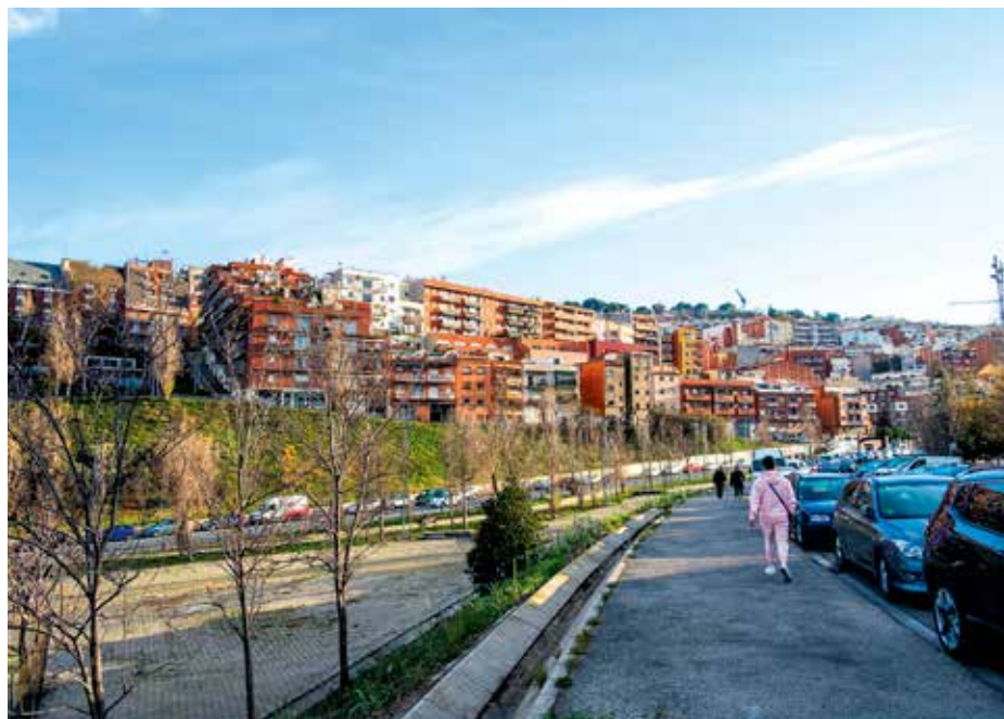
Blocs d'habitatges del barri de la Teixonera.

És necessari continuar el desplegament de les escoles bressol, impulsar polítiques contra la segregació escolar i fer millores en la dotació dels centres educatius. També expandir les activitats culturals al conjunt dels barris, reforçant les iniciatives locals. Cultura per la igualtat i contra la discriminació.