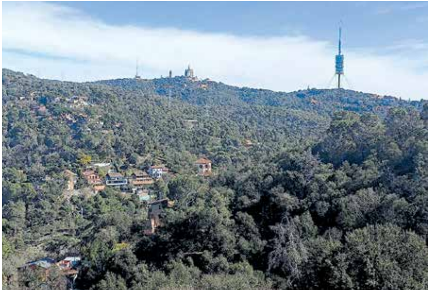
Collserola vista des dels barris de muntanya. AV MAS GUIMBAU-CAN CASTELLVÍ