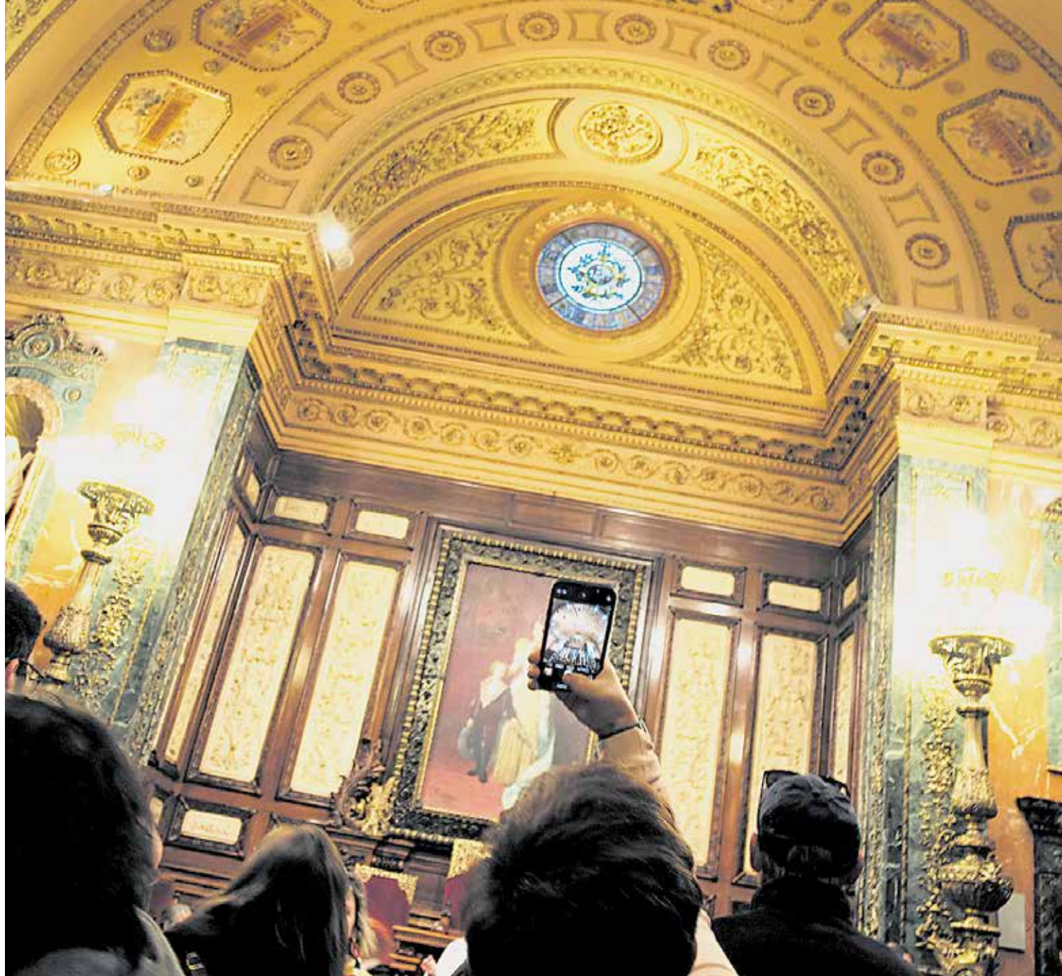
Dia de portes obertes a la Casa Gran el passat 11 de febrer, amb motiu de la celebració de Santa Eulàlia. JOAN MOREJÓN