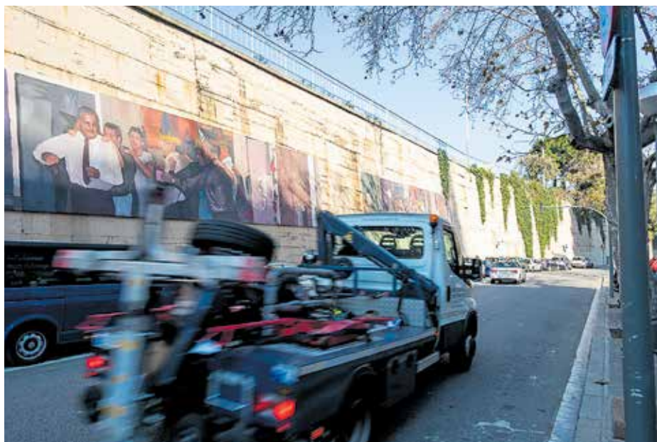
El mur de la Meridiana, entre Sant Andreu i Nou Barris.

Si bé les actuacions que s'han dut a terme fins ara a la Meridiana han consistit en una obra urbanística de dificultat mitjana -ampliació de voreres, reducció de carrils, creació de parterres i implementació d'un carril bici central-, els arquitectes i enginyers que assumeixin ara el projecte hauran d'escarrar-s'hi una mica més. Per una banda, el veïnat exigeix que l'actual fisonomia d'autopista desaparegui de totes totes. Per l'altra, les entitats volen que s'executi la proposta municipal més ambiciosa. És a dir, la que suprimeix el mur de fins a nou metres d'alçada a la banda de Sant Andreu i, a la vegada, esborra del mapa el pont del Dragó. "Volem que els dos laterals de