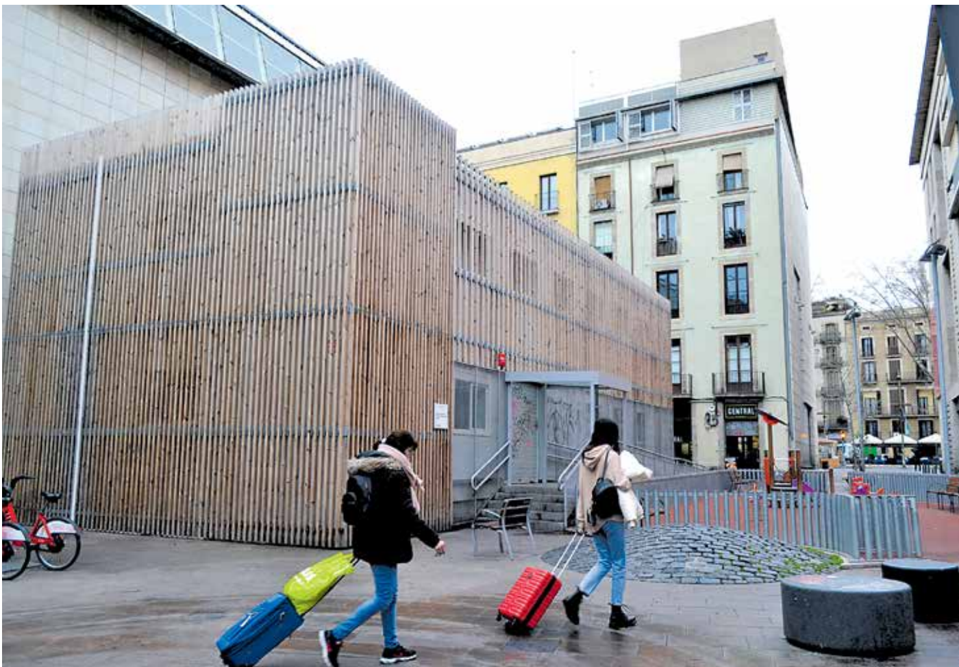
El mòdul 'provisional' del CAP del Gòtic s'ha menjat mitja plaça de Joaquim Xirau i els seus jocs infantils.