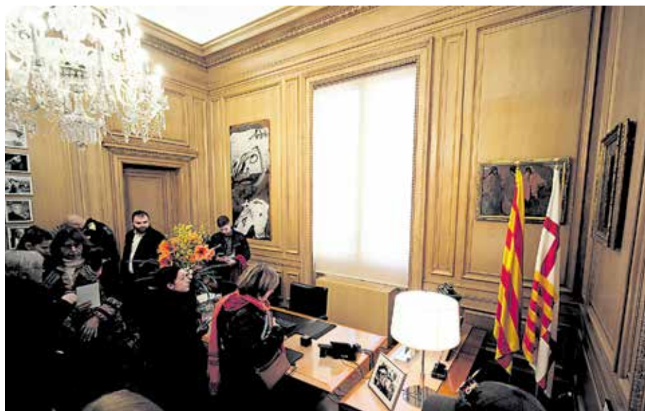
Ciudadans visiten el despatx de l'alcaldesa. J. M.

Les eleccions són una batalla més de la 'guerra dels Trenta Anys' per l'hegemonia i el model de ciutat que es lliura des de la Barcelona del 1992