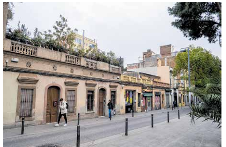
Casetes afectades al carrer de Ramón y Cajal, a tocar de Joanic. DANI CODINA

La Modificació del PGM preveu una zona verda i una d'equipaments a l'entorn de la plaça, amb 400 finques afectades