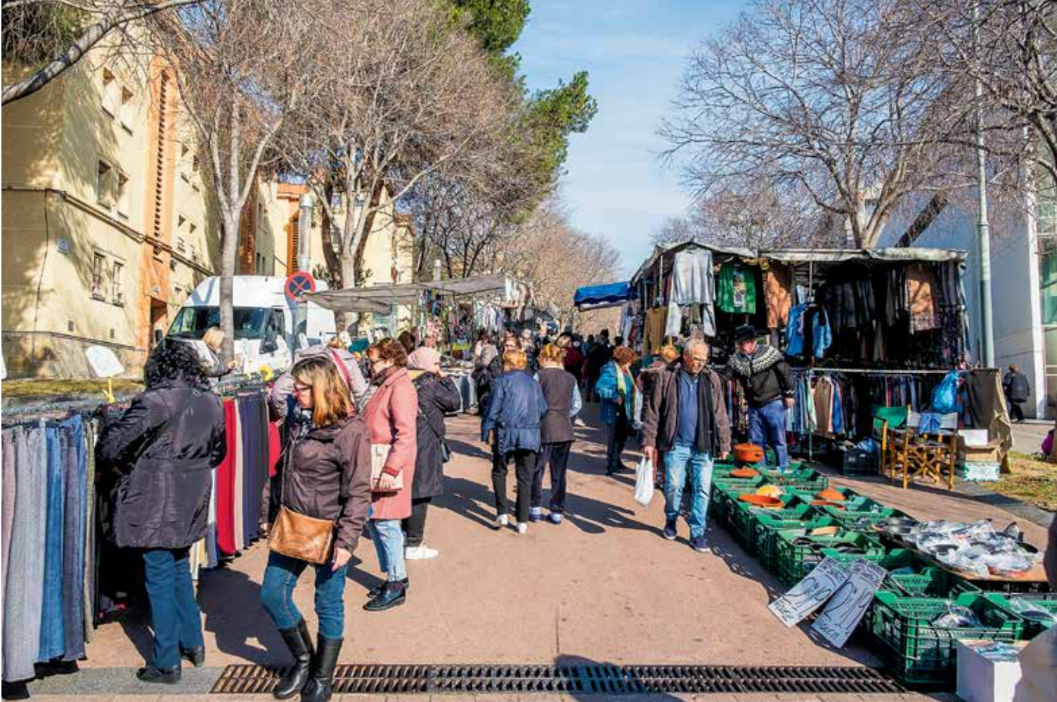
Un dimecres qualsevol al Mercadet del barri de la Trinitat Nova.