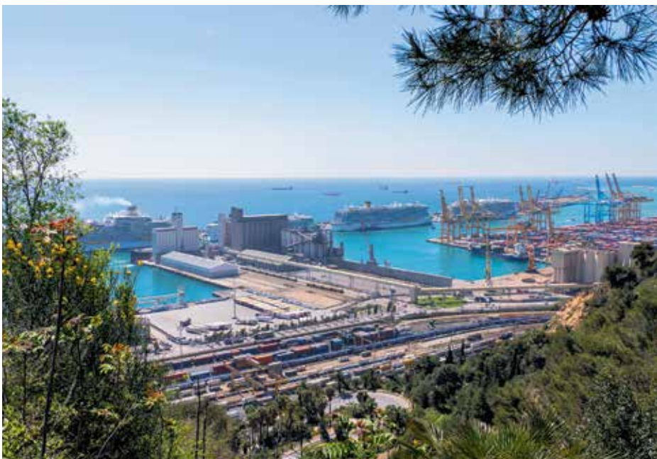
Creuers al Port de Barcelona, el 2022.

L'estació de mesurament de l'Eixample va ser l'única de l'Estat en superar els límits de contaminació establerts per la UE