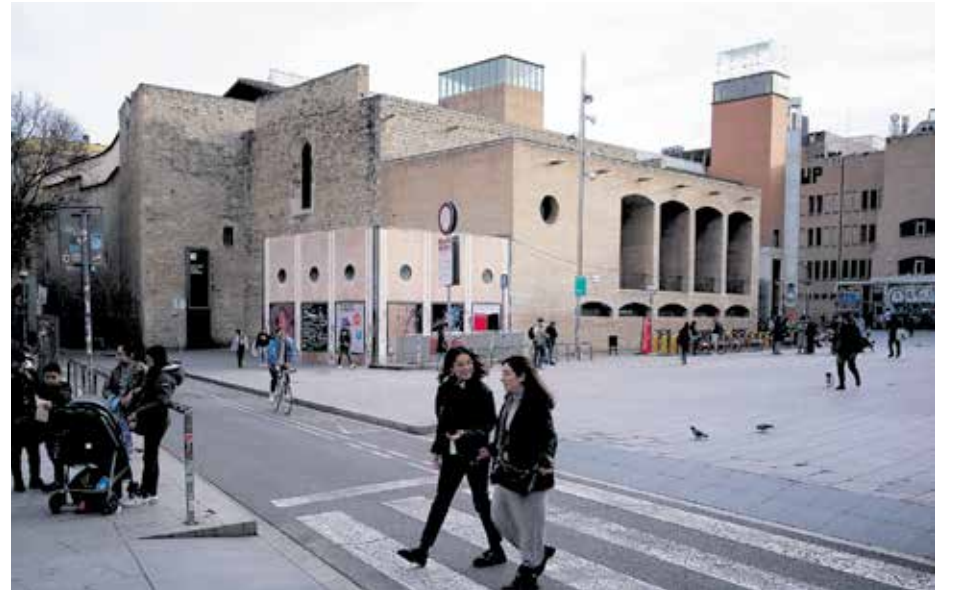
El Convent dels Àngels i la part de la plaça on es vol ampliar el Macba. JOAN MOREJÓN

La Xarxa Veïnal va presentar al·legacions, però com que aquestes no van pros-