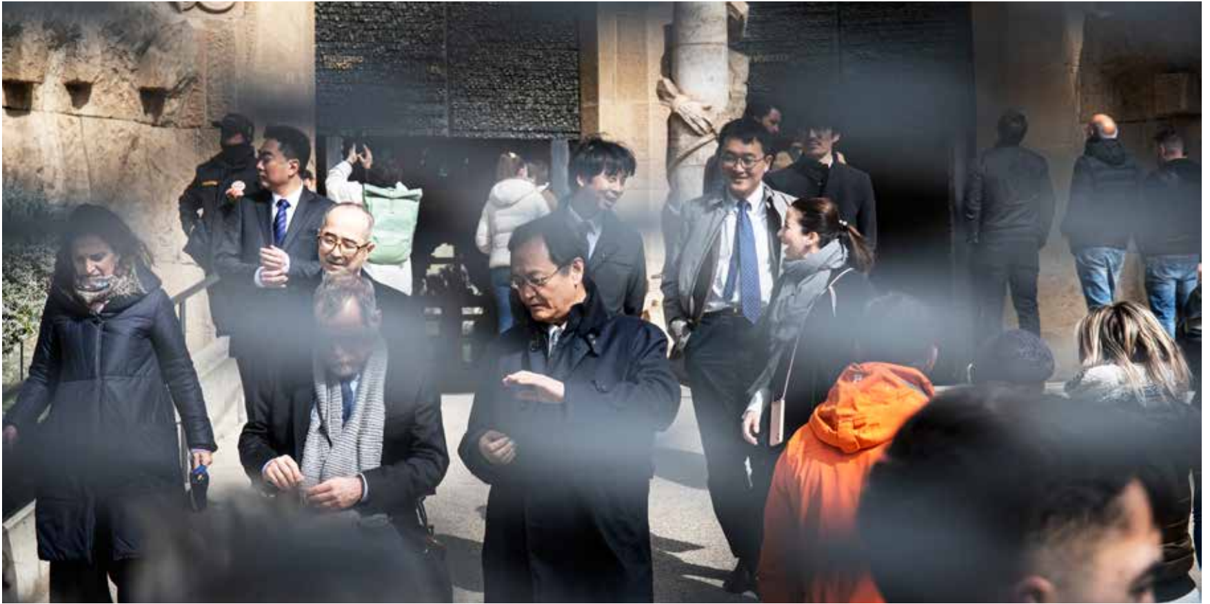
Un grup de visitants a l'altra banda de la reixa que envolta la Sagrada Família, la setmana del Mobile World Congress. MARC JAVIERRE