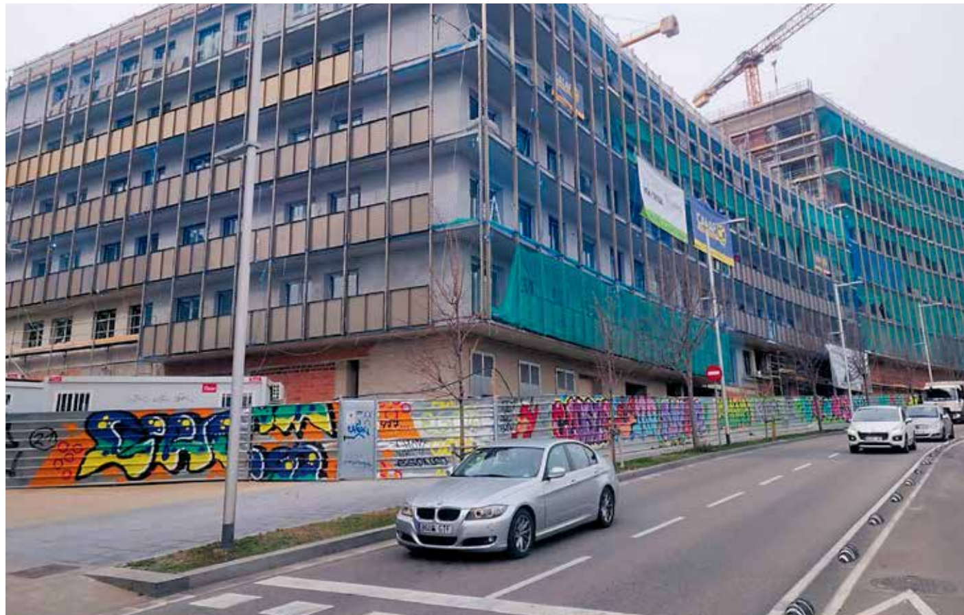
Obres de la promoció del barri de la Clota, a Barcelona, amb 105 habitatges protegits.

Els bons resultats històrics no han sigut suficients per convèncer l'actual executiu municipal, que ha prioritzat polítiques de lloguer i cohabitatge