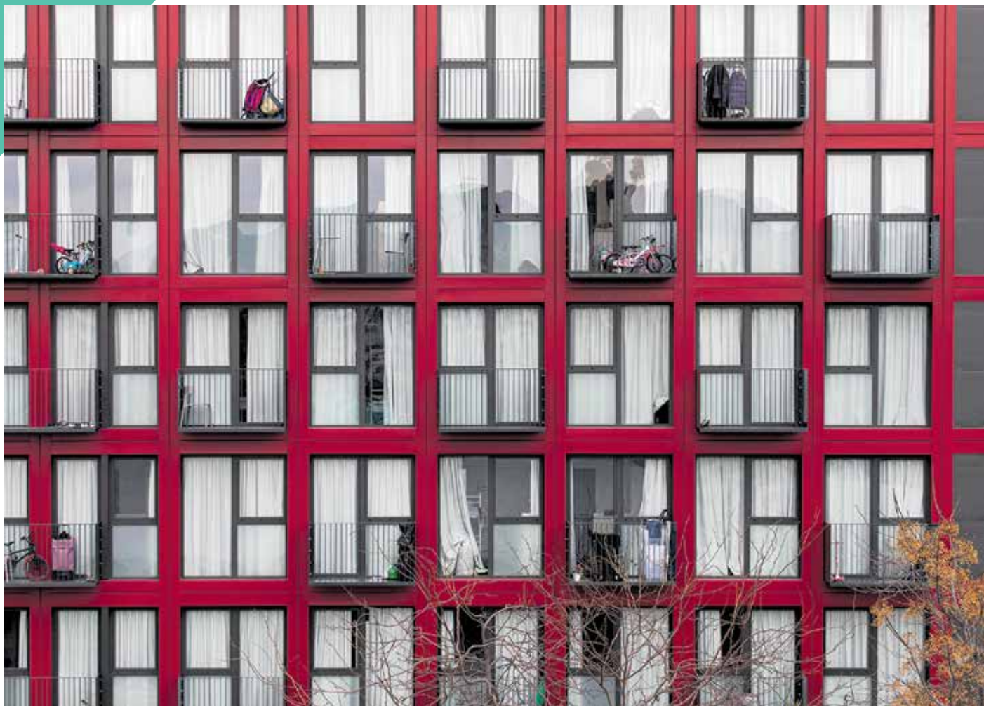
Pisos de alojamiento temporal para emergencias habitacionales en la plaza de les Glòries.