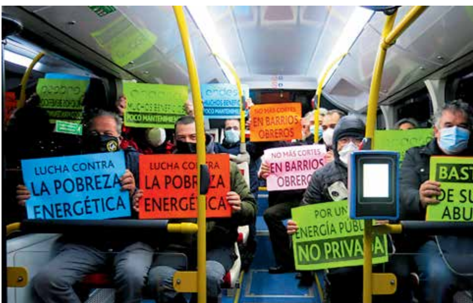
Activistes de Nou Barris 'baixen' en bus a la plaça de Sant Jaume, per manifestar-se contra els talls de llum, l'any 2021.

A llarg termini, és necessari recuperar la gestió dels serveis bàsics per garantir-ne l'accés universal