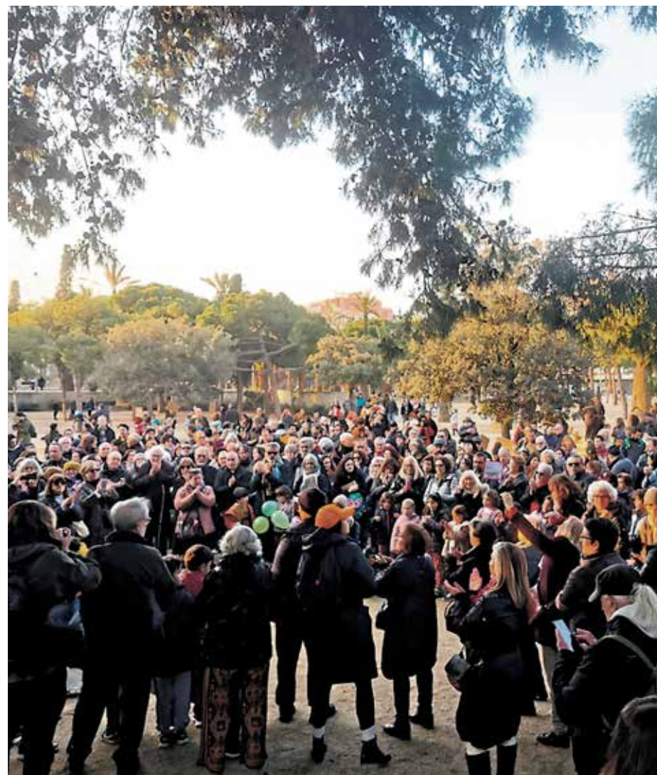
Multitudinària acció veïnal el 3 de març contra la destrucció de l'arbreda del parc de Joan Miró per les obres de la línia 8 dels FGC. AV ESQUERRA DE L'EIXAMPLE