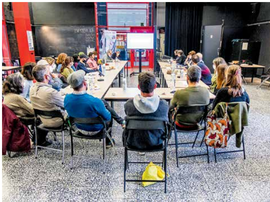
Assemblea a l'Ateneu Popular 9 Barris, el 2022. JOAN LINUX-9 BARRIS IMATGE

Si bé la gestió cívica a Barcelona no perilla, cal el compromís dels partits polítics, i la complicitat dels aparells tècnics per poder-la impulsar. I per poder canviar el marc normatiu caldrà incidir a nivell català o europeu.