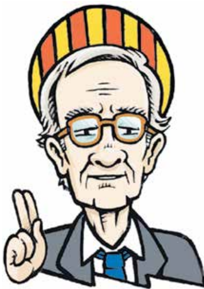
Xavier Trias JUNTS PER CATALUNYA